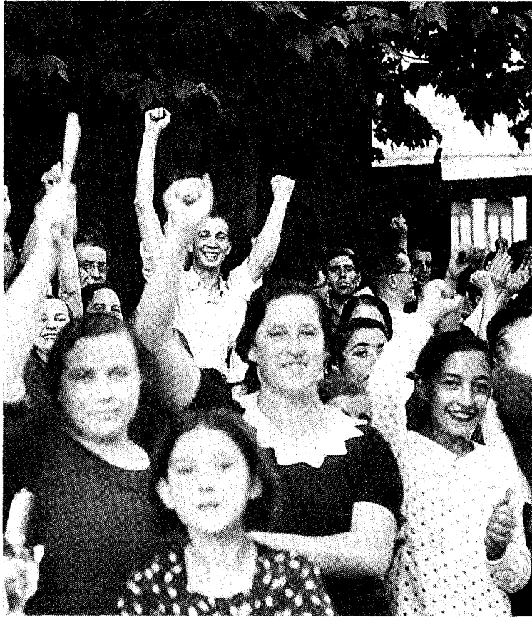
GIOVANI IN FESTA A MADRID DURANTE LA GUERRA CIVILE